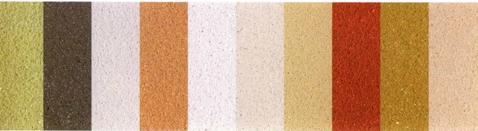
Farbspektrum der conluto Lehmputze

Die Farben der Natur, von ocker über eine sattes Orange bis zum dunklen Rot, so vielfältig ist die Farbpalette von Lehm. Assoziationen wie der Ayers Rock, die Sonnenpyramide und durch die Finger rieselnder Dünen sand verbinden sich mit den farbigen Lehmputzen von conluto . Durch Beimischungen von Quarzsanden ergeben sich auffallend, schillernde Effekte.