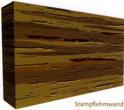
Stampflehmwand als Wärmespeicher

Ein Wohlbefinden in den eigenen Räumen ist der Wunsch jedes Menschen. Dazu gehört nicht nur das Wissen in einem Umfeld ohne Schadstoffe zu leben, sondern auch optimale Raumtemperaturen und ein schönes Ambiente. Wandflächen aus Lehm bieten ein Raumklima das auf diese Bedürfnisse abgestimmt ist. Gerade in Verbindung mit Wandheizung und dem conluto Dämmsystem werden warme Oberflächen geschaffen und Behaglichkeitzonen gebildet.