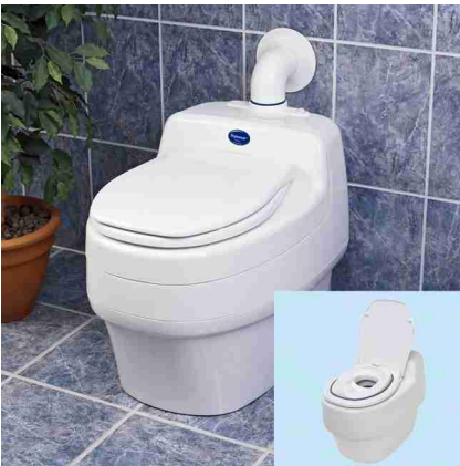
Separett Villa die komfortable Trockentrenntoilette