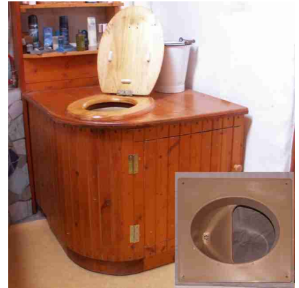
Selbstbau-Satz die preiswerte, individuelle Lösung