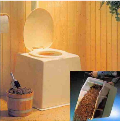
SAWI-biocom Rindenschrottoilette die einfache Lösung fürs Gartenhaus

umweltfreundlich - hygienisch - wassersparend