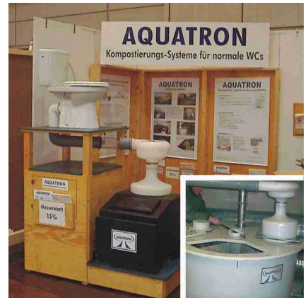
AQUATRON-System Komposttoiletten für wassersparende WCs