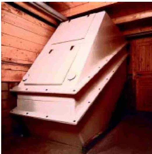
Kompostbehälter für 4-Personen-Haushalt