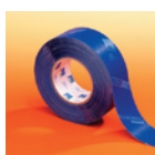
TESCON No. 1 Allround-Klebeband für innen und außen