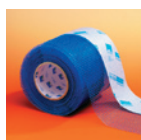
CONTEGA PV Für den sicheren Anschluss an zu verputzende Untergründe