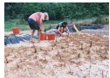
Pflanzen der Schilfsetzlinge

AQUATRON-Vertrieb in Deutschland: NaturBauHof