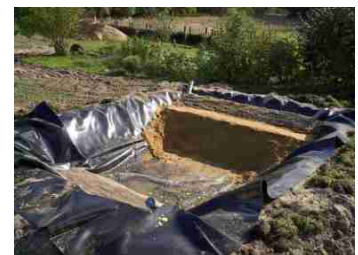
Ein- und Auslaufkullisse