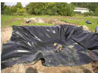
PE-Folie für das Pflanzenbeer