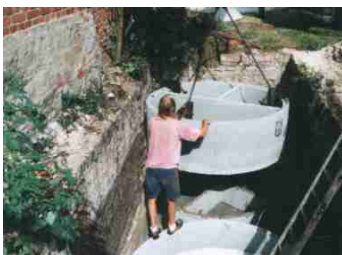
Einsetzen der Dreikammergrube

Für Grundstücke mit ausreichender Größe ist diese naturnahe Lösung eine sehr kostengünstige Variante, die ideal im Selbstbau mit geringer fachlicher Anleitung errichtet werden kann.